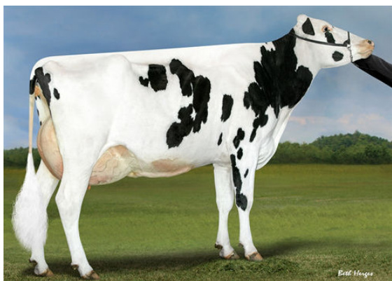
PROGENESIS DUKE MELEE GRANDDAM